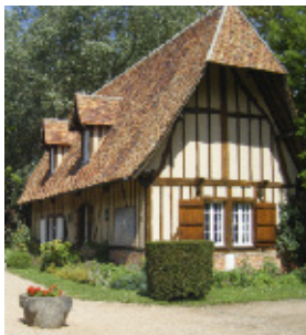
Musée Michelet - Créé en 1989