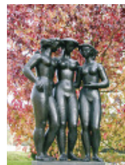
VOLTI "Les 3 Grâces" Bronze - 1967