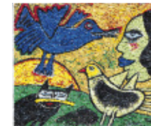
CORNEILLE "Le chat à l'affût" Mosaïque - 1991

Sur les Routes Normandie-Vexin et des Maisons d'Ecrivains Membre des Sites et Monuments de Normandie Membre du Club des Parcs et Jardins de Normandie Partenaire de la Route des Abbayes Normandes