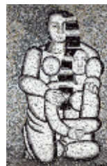
FERNAND LEGER "La Mère et l'Enfant" Mosaïque - 1974