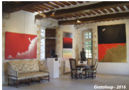
Grataloup - 2016