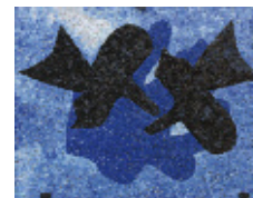
BRAQUE "Pelias et Nélée" Mosaïque - 1963/2007