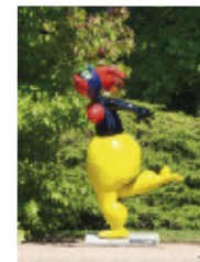
JACKY COVILLE "Madame Citron" Céramique - 2000