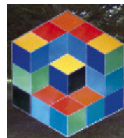
VASARELY "Hexa VP" Lave émaillée - 1982