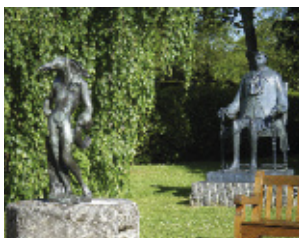
DALI "L'Homme Oiseau" Bronze - 1972