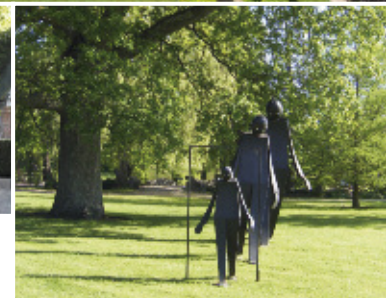
OLIVIER GERVAÏL "Les Trois pas" Tôle peinte - 1998