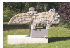
SZÉKELY "Dragon Bisexuel" Granit rose - 2000