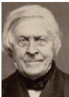
NADAR "Jules Michelet" Photographie - vers 1860