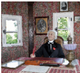
"Lieu d'intimité, de plaisir, de rêverie... Le grand charme du jardin... Moi, amoureux de Vascœuil ! " Michelet - (Journal - 1860)