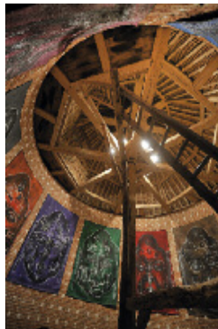
KIJNO Série des Boudhas du colombier Papiers froissés - 1986