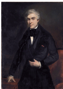
Michellet par Belloc 1845

Jardins à l'anglaise et à la française (1774) traversés par les méandres du Crevon. Chêne pluricentenaire. Galerie de hêtres.