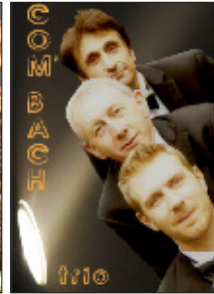
Com' Bach Trio