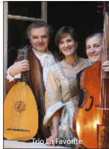
Trio La Favorite