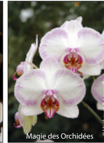
Magie des Orchidées

VISITE GLOBALE (Château, Colombier, Exposition, Musée Michelet, Jardins & Parc de sculptures) 9,50 € (Adultes) 6,50 € (+7 ans, étudiants et Pôle Emploi) - Handicapés : 5,50 € - Forfait Famille : 25 € Groupes RdV (+ 20 pers.) : 7,50 € - (> 12 > 19 pers.) : 8 € - Scolaires : 4 € - Accueil 20 mn + 1,50 € - Guidée 60 mn + 3 €