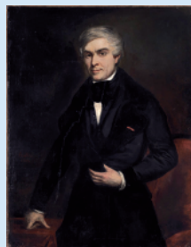
Michelet par Belloc 1845

Sur place "LA CASCADE" : Salon de Thé, (Restaurant pour groupes)