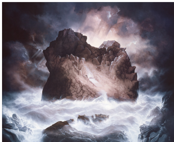
Yves Thomas "Ile noire obsydienne" hst 81 x 100 cm

UNE CENTAINE D'ŒUVRES et au RENDEZ VOUS : Poésie, Mystère et Beauté